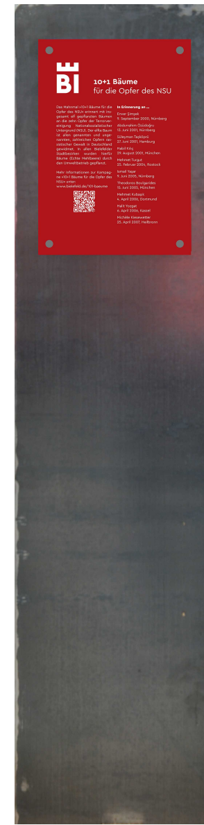
Darstellung Stele mit Text