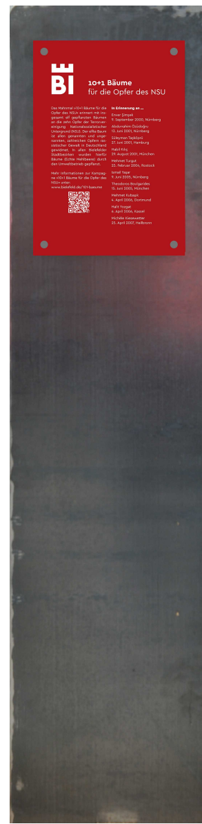
Darstellung Stele mit Text