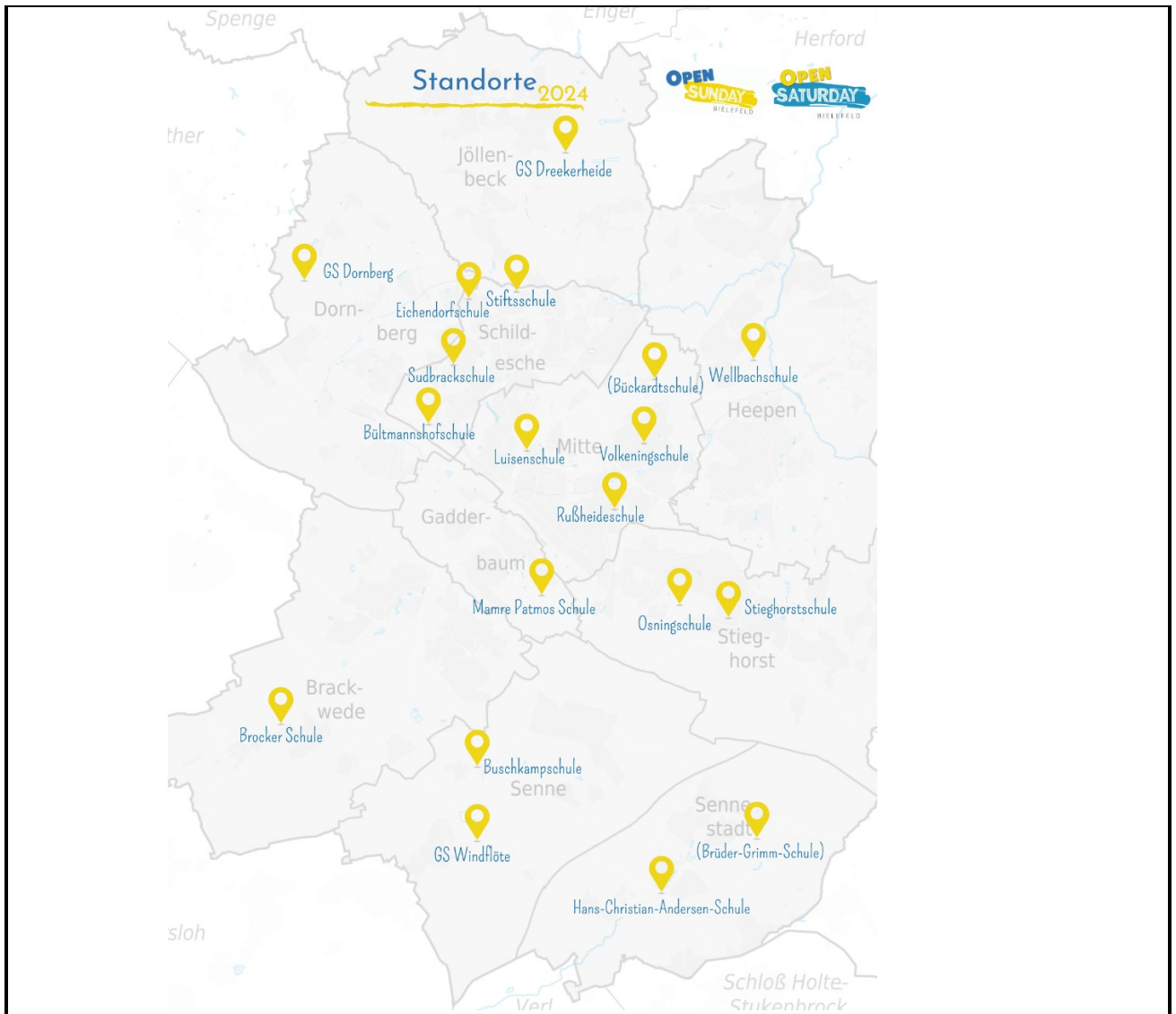
Abbildung 1: Standorte Open Sunday