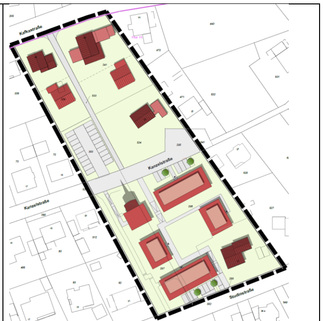
Gestaltungsplan, ohne Maßstab