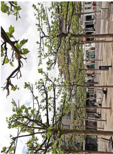
Sitzbänke unter Baumkarree