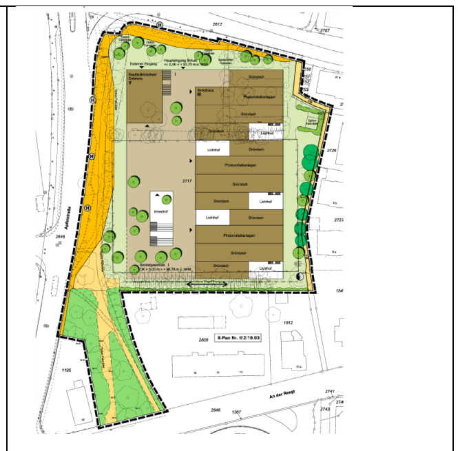
Gestaltungsplan, ohne Maßstab