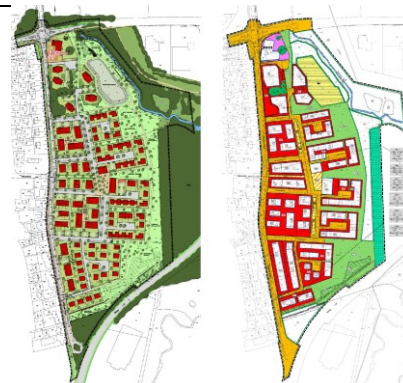
Gestaltungsplan, Nutzungsplan ohne Maßstab