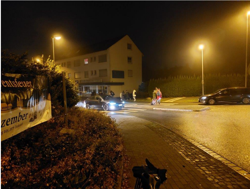
Standort Adlerdenkmal mit Blick Vilsendorfer Straße