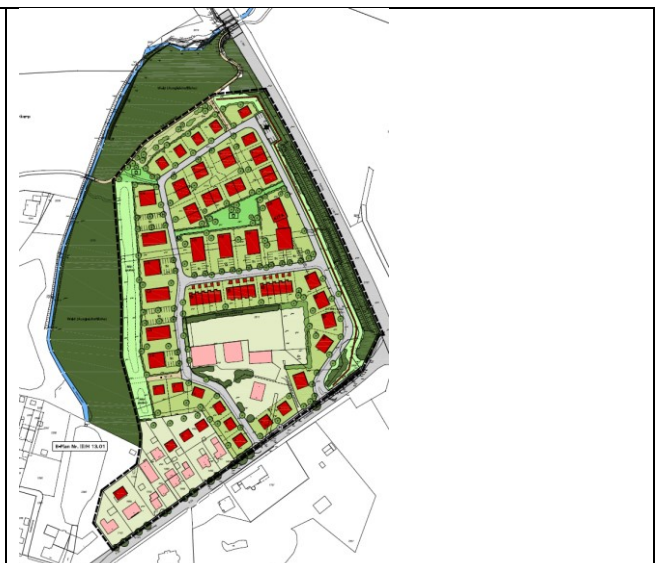
Gestaltungsplan, ohne Maßstab