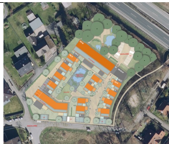
Städtebauliches Konzept, ohne Maßstab