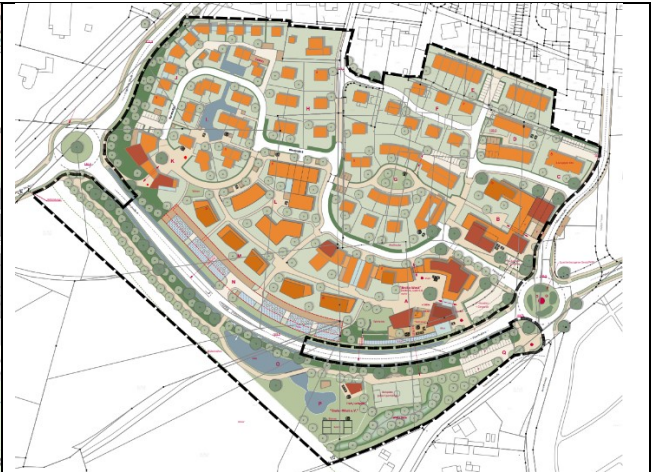
Gestaltungsplan, ohne Maßstab