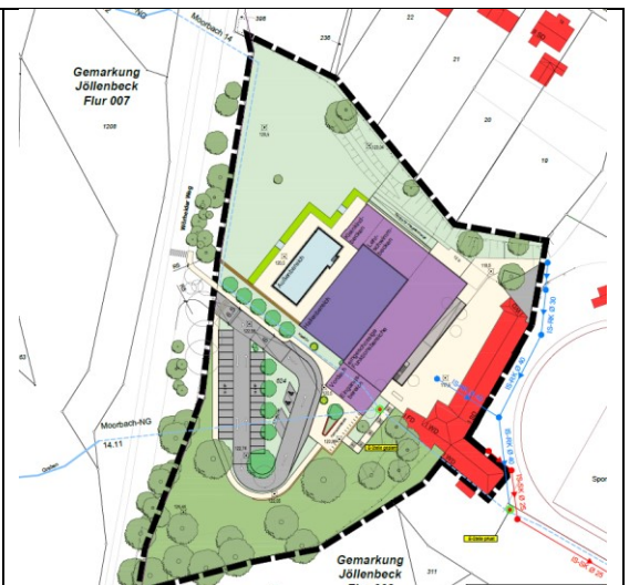
Gestaltungsplan, ohne Maßstab