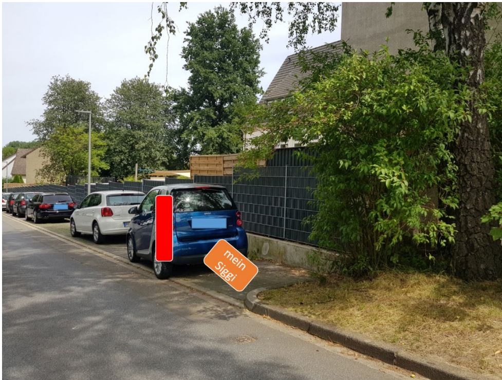
Temporäre Station meinSigg! am Freibad Dornberg