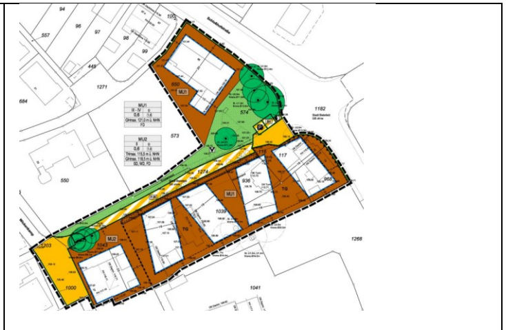
Gestaltungsplan, ohne Maßstab