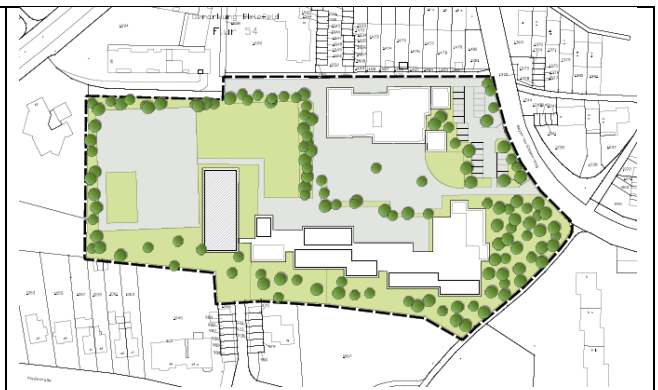
Gestaltungsplan, ohne Maßstab