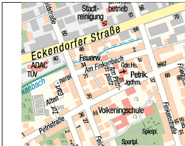
Lage im Stadtgebiet, ohne Maßstab

Beschluss zur Durchführung der Beteiligungen gem. §§ 3 (2) und 4 (2) i.V.m. § 4a (3) Baugesetzbuch (BauGB)