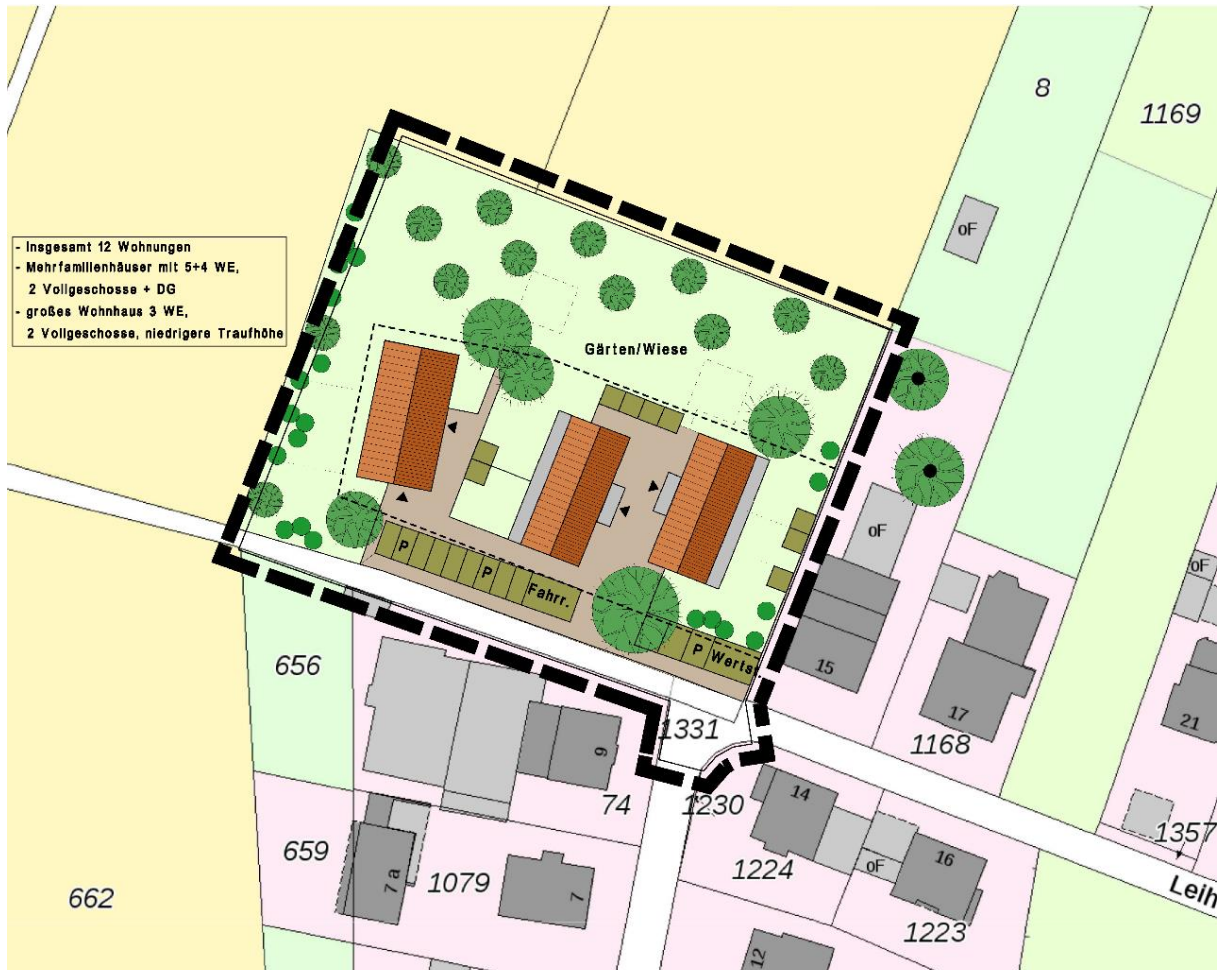
Lageplan/Vorentwurf mit Geltungsbereich des Bebauungsplans Nr. II/Ba 8, Planungsstand Oktober 2019, Maßstab im Original 1:500, hier verkleinert