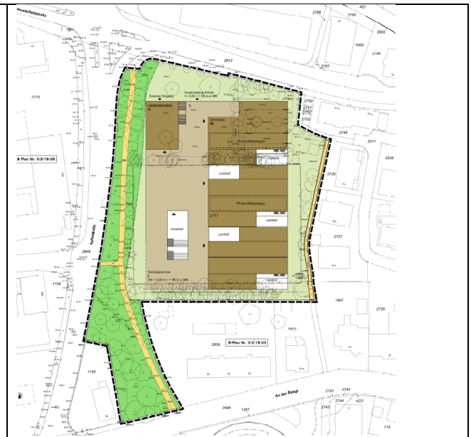
Gestaltungsplan, ohne Maßstab