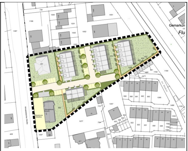
Gestaltungsplan, ohne Maßstab