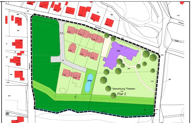
Gestaltungsplan, ohne Maßstab