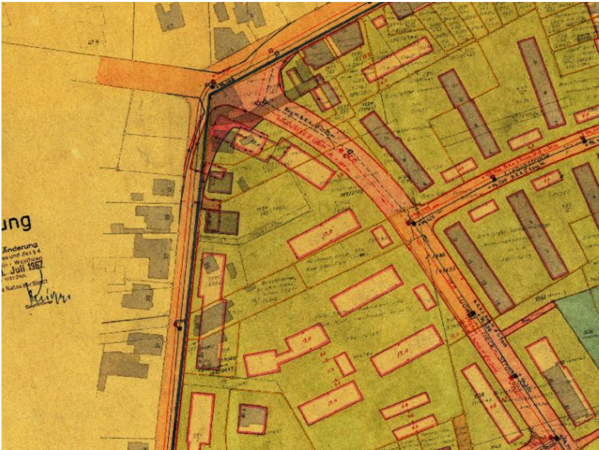
Abb. 3: Rechtsverbindlicher B-Plan (Online-Kartendienst der Stadt Bielefeld, eigene Überarbeitung)