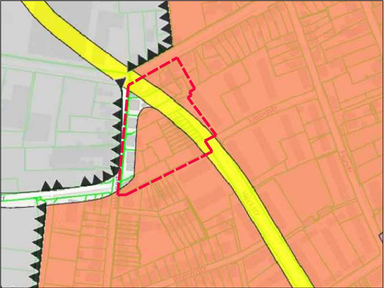
Abb. 2: Auszug wirksamer Flächennutzungsplan (Online-Kartendienst der Stadt Bielefeld, eigene Überarbeitung)