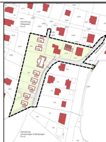
Gestaltungsplan, ohne Maßstab