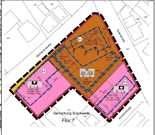
Nutzungsplan, ohne Maßstab