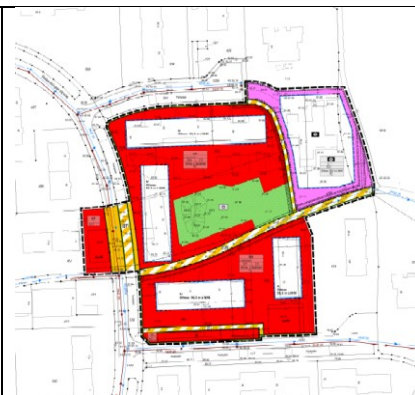
Nutzungsplan, ohne Maßstab