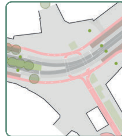
Sicherheitsbarrieren bei Großveranstaltungen

Die genaue Position des mobilen Grüns kann nach erfolgter Baumaßnahme festgelegt werden.