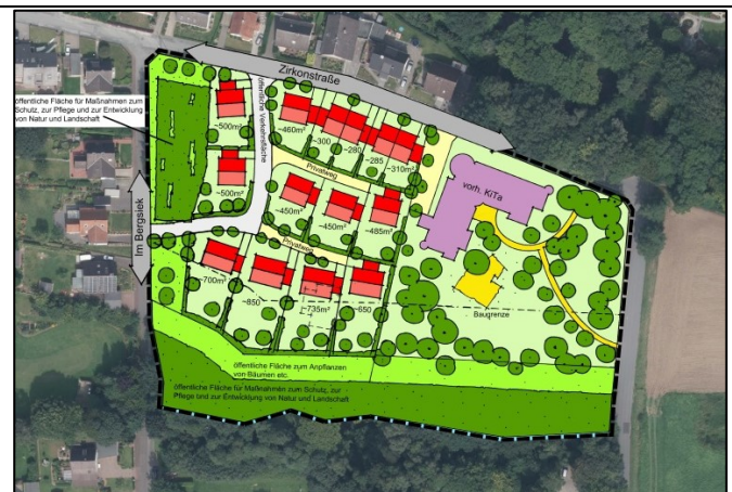
Gestaltungsplan, ohne Maßstab