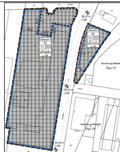
Nutzungsplan, ohne Maßstab