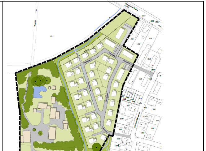
Gestaltungsplan, ohne Maßstab