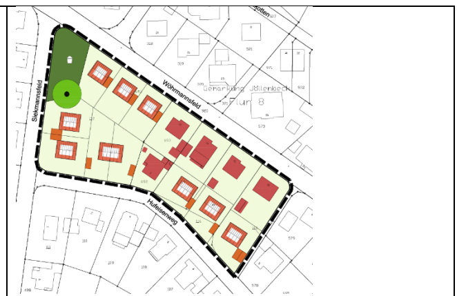
Gestaltungsplan, ohne Maßstab