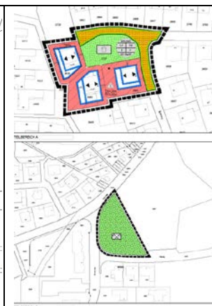
Nutzungsplan, ohne Maßstab