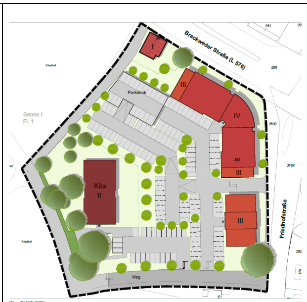
Detailplan, ohne Maßstab