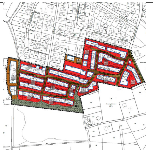
Detailplan, ohne Maßstab