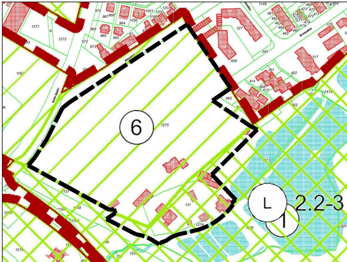
Abb. 4: Auszug aus dem Landschaftsplan mit Abgrenzung des Geltungsbereiches