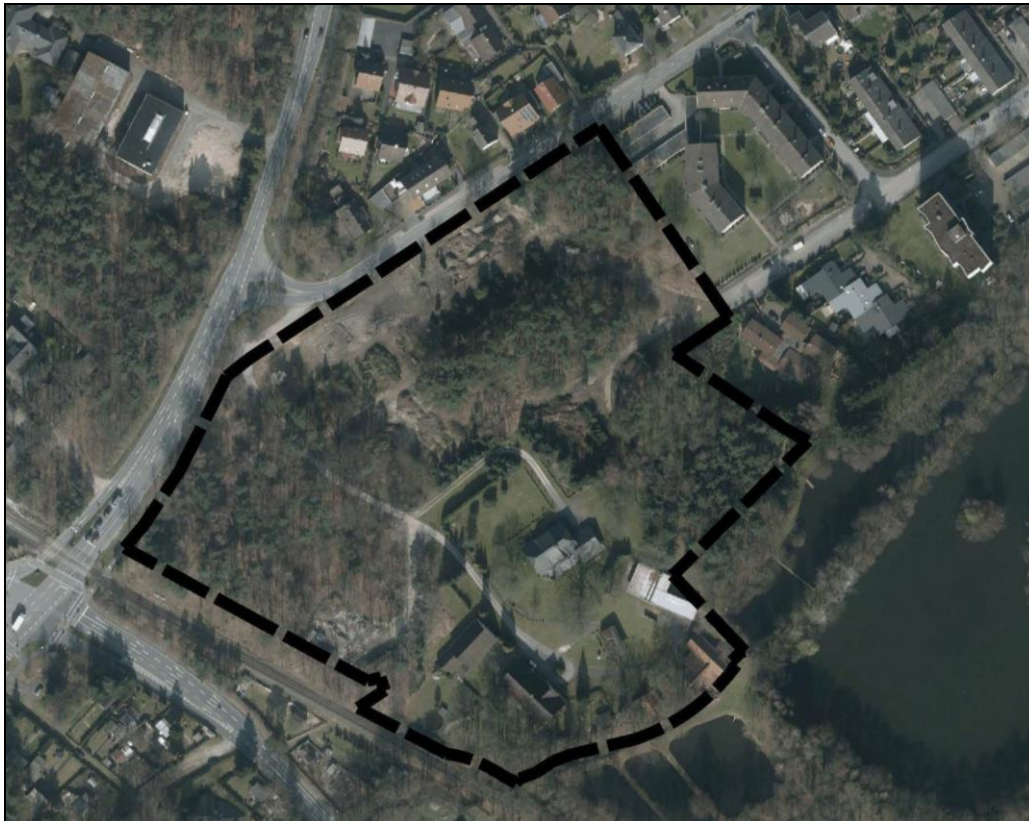
Abb. 2: Luftbild mit Kennzeichnung des Geltungsbereiches des Bebauungsplanes