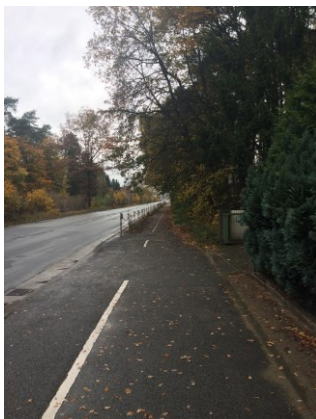
Zwei Bilder aus Oktober 2017

Die jetzige Jahreszeit würde sich für einen Rückschnitt noch anbieten.