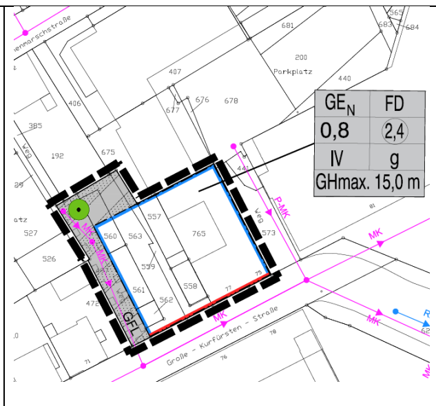
Nutzungsplan, ohne Maßstab