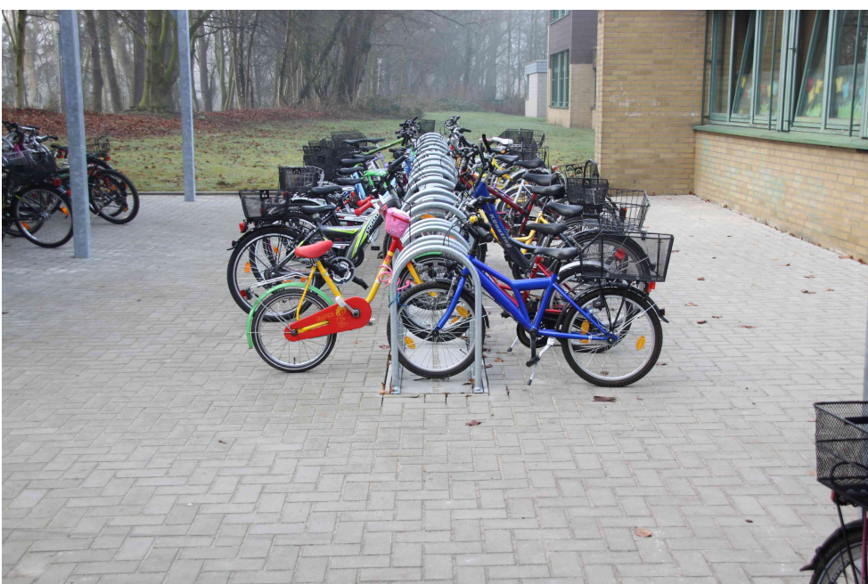
Forte in Fundamentsteinplatte