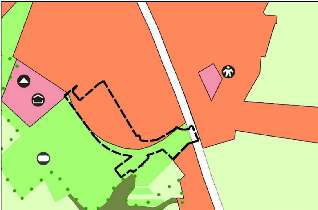
Abb. 2: Auszug aus dem rechtswirksamen Flächennutzungsplan mit Abgrenzung des Plangebietes