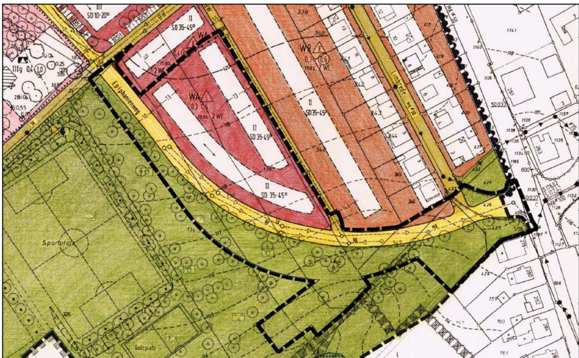
Abb. 3: Auszug aus dem rechtsverbindlichen Bebauungsplan Nr. II/V 2 „Epiphanienweg“