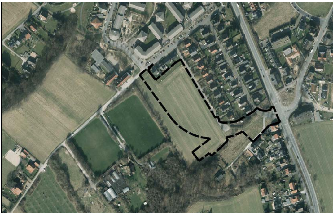
Abb. 1: Luftbild