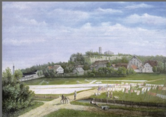
Kortens Bleiche von Th. Kade, aus dem Bestand der Kunsthalle Bielefeld

Bleichfelds Wohlstand begründete sich auf einem gut entwickelten, handwerklichen Leinewerke, das allerdings ab 1850 durch das Aufkommen von industriell hergestellten Stoffen verdrängt wurde. Nach und nach gaben die Weber und Bleicher ihr Handwerk auf. Die Bleichwiesen wurden größtenteils gawerlich überbaut. Nur Bolbrinkers Wiese, die ehemalige Kötterhönersche Bleiche, blieb unbebaut, weil sie seit 1885 als Sportfläche genutzt wurde.