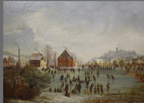
Bolbrinkers Eisbahn von Th. Kade, aus dem Bestand der Kunsthalle Bielefeld

Kortens Bleiche is the name of the painting created by Theobald Kade in 1883. This bleich was located where nowadays the Dr. Oetker Welt is situated. From the 17th century you found a dozen bleiches by different owners - beginning at the todays Adenauer Platz - along the road to Gütersloh.