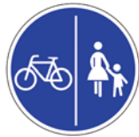
Getrennter Geh- und Radweg

Außer ... der Weg ist nicht befahrbar (z.B. durch parkende Autos), dann darf ausnahmsweise auf der Straße gefahren werden.