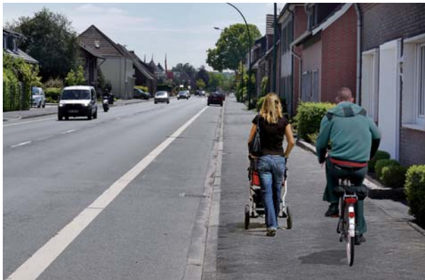
Gehweg, der für Radfahrer freigegeben ist