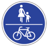
Gemeinsamer Geh- und Radweg