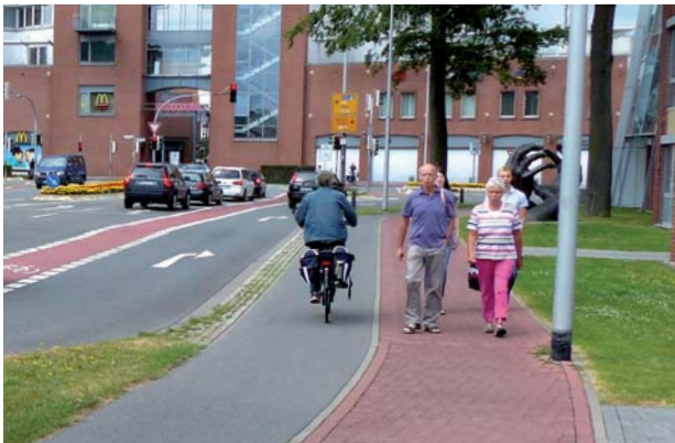
Getrennter Geh- und Radweg

Außer ... der Weg ist nicht befahrbar (z.B. durch parkende Autos), dann darf ausnahmsweise auf der Straße gefahren werden.