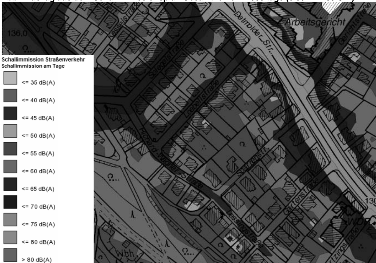
Abb.: Auszug aus dem Schallimmissionsplan Gesamtverkehr 2008 tags (6.00 – 22.00 Uhr)