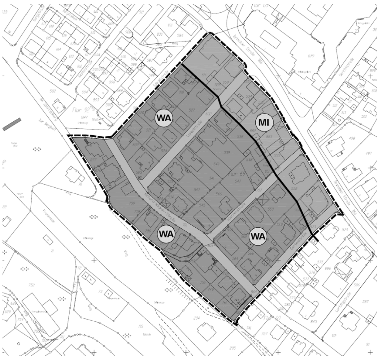
Abbildung: Grobe Plankonzeption (ohne Maßstab)

Auf die folgende Abbildung zur Darstellung der grundsätzlichen, gestaffelten Plankonzeption zur Art der baulichen Nutzung wird verwiesen.